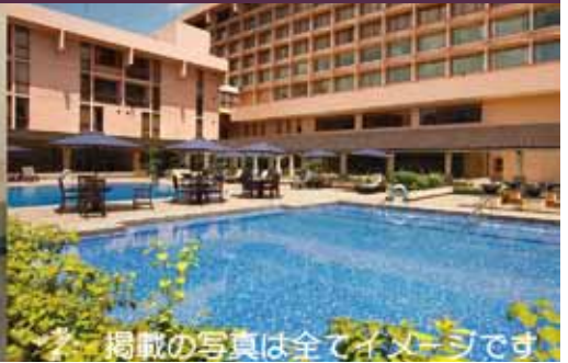
掲載の写真は全てイメージです